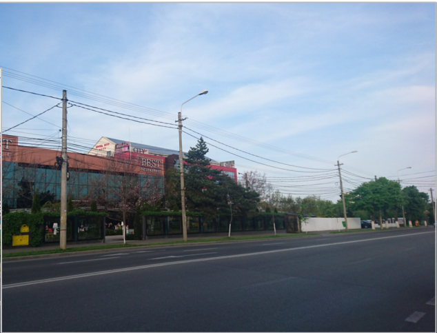
profil bd Republicii